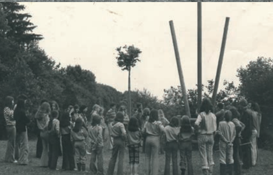
1974 Assens, 10 ème anniversaire