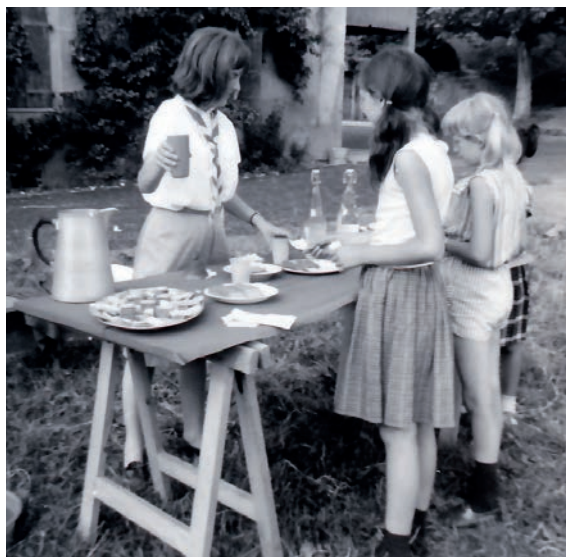
1965 1er Camp d'été Claires-Flammes, Emmaüs St- Légier