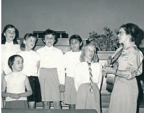
1965-1967 Claires-Flammes, cercle du feu, Assemblée de la Tour, Lausanne