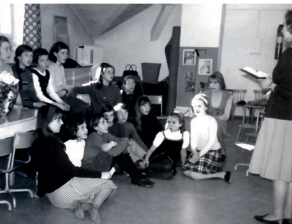
1964 Claires-Flammes, cercle du feu